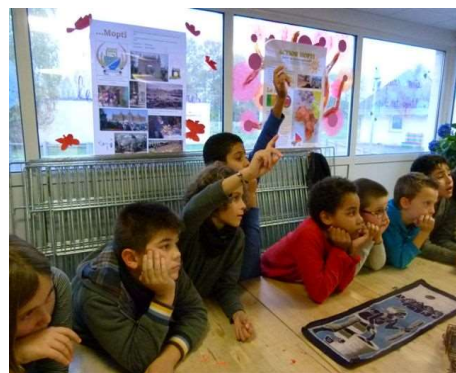
L'heure du conte