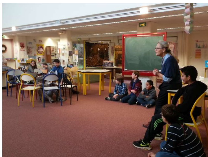
Animations jeu des chaises

Ce jeu très interactif interpelle les enfants et les amène à réfléchir sur des solutions citoyennes de développement solidaire et durable.