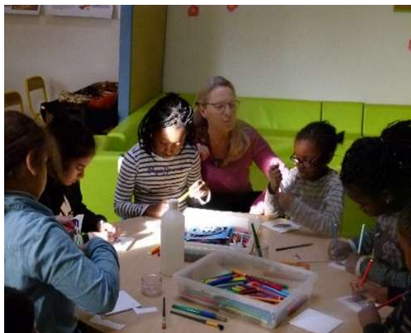
Création de boîtes de collecte Terracycle