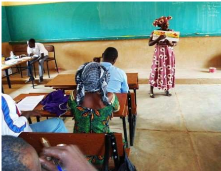
Formation des enseignants