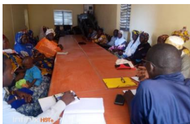
Information sensibilisation des leaders Communautaires et d'associations de SOMASSO

Dans le cercle de Mopti : 9 groupements démunis de jeunes, 29 groupements démunis féminins et 15 groupements démunis mixtes (manque 38)