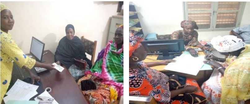
Ouverture de compte à la caisse Nayral NEF de l'association Douwawou et Yelen de Socoura

Seize (16) groupements démunis ont ouvert leurs comptes à la caisse Nayral NEF sur 50 GD prévus. Il s'agit des groupements de Mopti avec 8 groupements et Socoura avec 8 groupements. Un (1) groupement de Médina Coura (Bandenya ton) est déjà affilié à la caisse de Nyéta Musow. Les 153 groupements démunis de Bla ont ouvert leurs comptes à la caisse NYESIGISO, RMCR, CAEC DJIGISEME, SORO YIRIWASO