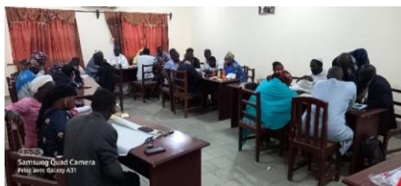
Forum de Mopti

Commenté [DF2]: De quelles mauvaises pratiques s'agit-il ici ?