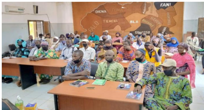
Session de formation des relais du cercle de Bla

Sur la base des Critères de sélection du Projet 100 relais communautaire dont 25 à Mopti et 75 à Bla ont été sélectionnés et formés pour assurer la pérennisation des acquis du Projet INCLUSIF.