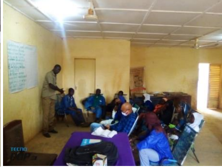
commune de Petaka/cercle de Douentza