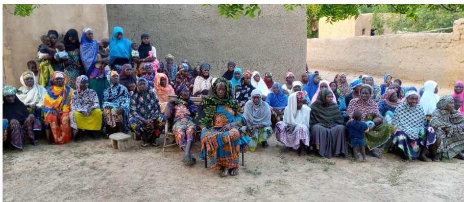
Séances de restitution de résultat du diagnostic aux membres des GD de N'Diérésso

Sélection des nouveaux groupements : Sur la base des critères de sélection prédéfinis, 150 Groupements Démunis ont été retenus dans le cercle de Bla et 53 dans le cercle de Mopti.