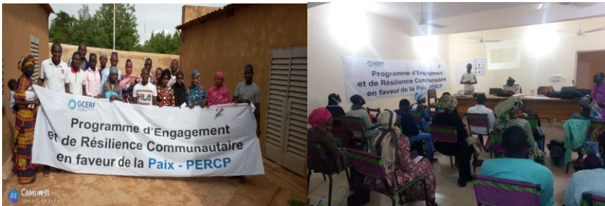
Atelier de formation des jeunes ambassadeurs à Douentza Atelier de formation des jeunes ambassadeurs à Djenné

136 jeunes ambassadeurs de 18 à 35 ans ont été formé en 3 sessions à Mopti, Djenné et Douentza sur les techniques de prévention et gestion des conflits ainsi que la lutte contre l'Extrémisme Violent.