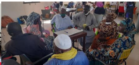
Forum de Djenné