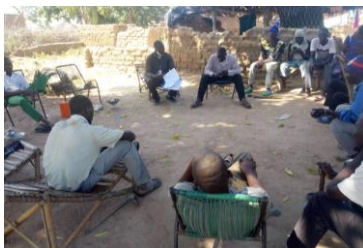
Séance de diagnostic du GD Tièssiri de Kokosso

Sélection des nouveaux groupements : Sur la base des critères de sélection prédéfinis, 150 Groupements Démunis ont été retenus dans le cercle de Bla et 53 dans le cercle de Mopti.