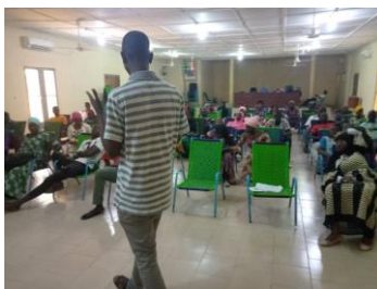
Formation dans la commune Djenné