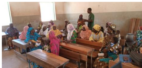
Cadre de concertation à Salsabé