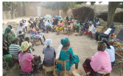
Séance animation sur le leadership féminin et jeune à Sien