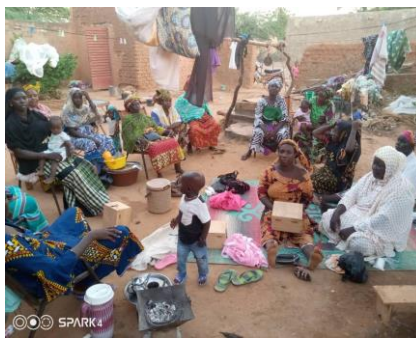
Séance d'animation sur la mobilisation de l'épargne dans le village de Djénéda (Commune de Mopti)