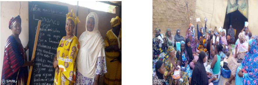
Démarrage des centres d'alphabétisation à Sévaré (commune urbaine de Mopti)

Seize (16) centres d'alphabétisation ont été ouverts dans les communes de Mopti et Socoura (5 à Sévaré, 3 à Médina-Coura, 2 à Bargondaga et 6 à Socoura village) 400 auditeurs (385 femmes et 15 jeunes) ont été inscrits.