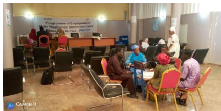
Cadre de concertation à Mopti