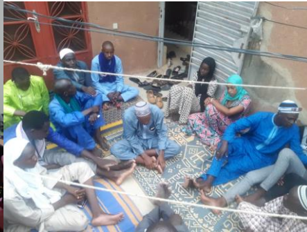
Formation dans la commune rurale de Dialloubé