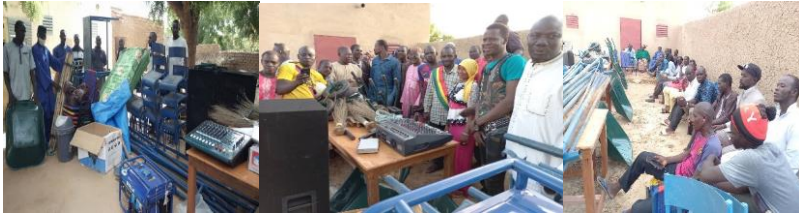
Communes de Fatoma, Korombana (cercle de Mopti)

Ci-dessus quelques images de réception des équipements des Maisons des Jeunes