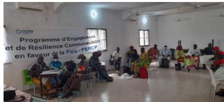
Atelier de formation des jeunes ambassadeurs à Djenné