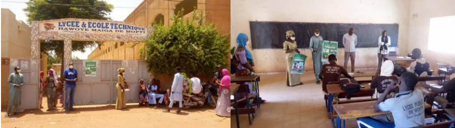
Campagne de sensibilisation Mopti sur le respect des mesures barrières en réponse à la covid-19

20 jeunes volontaires (10 filles et 10 garçons) ont mené une campagne dans 10 écoles (secondaires) et les camps des déplacés pour sensibiliser les élèves et déplacés des conflits communautaires sur la maladie à coronavirus et le respect des mesures barrière.