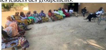
Validation en AG du plan de renforcement du GD Kotankègnè de Kana

Structuration des nouveaux groupements : le plan de renforcement élaboré a été validé et signé par les leaders des groupements.