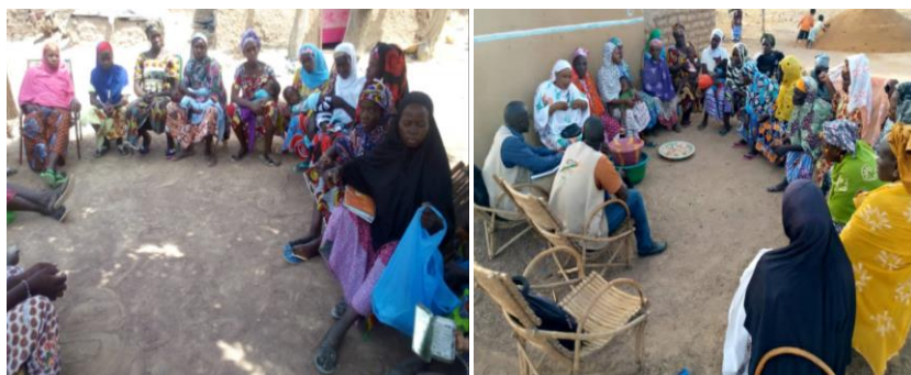
Renforcement des capacités des membres des GD de Falo sur les changements climatiques

Education nutritionnelle : les présidentes des 50 groupements de Mopti et 153 groupements de Bla ont été formées sur les nutriments, genre, égalité des sexes et inclusion sociale