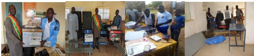
Communes de Wadouba, Doucombo, Dourou et Sangha (Cercle de Bandiagara)