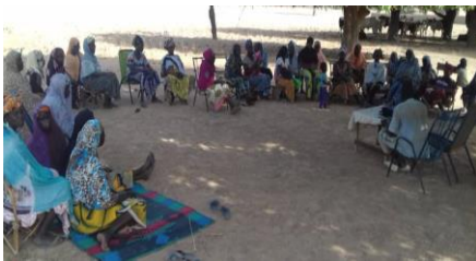
Animation sur le leadership féminin à Nèguèna

Post-alphabétisation : 1 474 membres des 50 groupements de Mopti et 4 460 membres des 153 groupements de Bla ont été formés en gouvernance ; gestion saine et efficace de ressources financières ; leadership féminin ; leadership jeunes, entrepreneuriat agricole et rural. Ils disposent tous en leur sein des outils de gestion