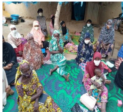
Séance d'animation sur l'allaitement maternel exclusif de l'association Benkadi et Nyéta dans le village de Bargondaga (commune de Mopti)

Résultats : le projet a permis d'installer 1 145 personnes dont 1 045 femmes et 100 jeunes dans les 2 cercles d'intervention d'Action Mopti, dans le cadre du Projet INCLUSIF.