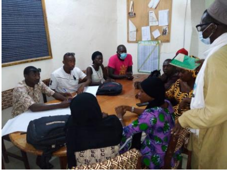
Commune de Mopti/cercle de Mopti