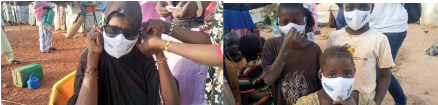
Sensibilisation sur les mesures barrières contre le COVID-19 et distribution de masques sur le site des déplacés à Mopti

Résultat : Plus de 5 000 élèves ont été touchés par la campagne de sensibilisation