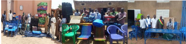
Communes de Derary et Dandougou Fakala (Cercle de Djenné)