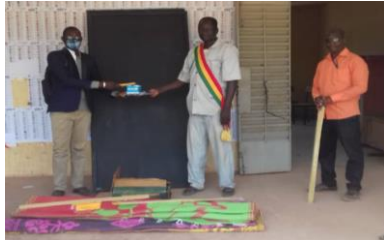
Réception des matériels des centres d'alphabétisation Session d'alphabétisation dans les Centre 1 et 2 de Kemeni De Yangasso par le 1er adjoint au maire

48 centres d'alphabétisation ont été ouverts dans 22 villages dans le cercle de Bla. 1224 auditeurs ont été inscrits