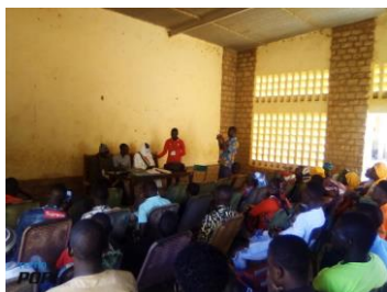
Formation dans la commune de Douentza

Continuer à considérer les jeunes comme les acteurs clés de la prévention de l'extrémisme violent.