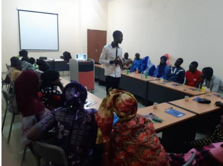
Formation des cibles de Kewa et Sasalbé à Mopti

Au total 764 personnes (42% femmes et 58% hommes).